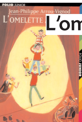
Illustration Dominique Corbasson