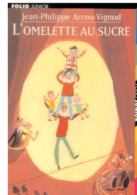
Illustration Dominique Corbasson

Travail préalable : relire chapitre 9, «les grandes vacances»