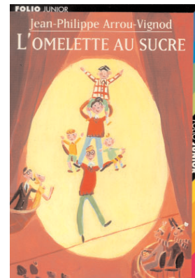
Illustration Dominique Corbasson