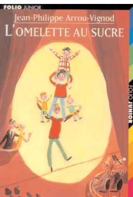
Illustration Dominique Corbasson

L'omelette au sucre, de Jean-Philippe Arrou-Vignod