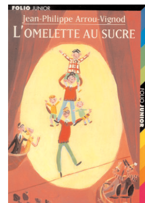
Illustration Dominique Corbasson

Travail préalable : relire chapitre 4, «un jeudi du club des cinq»